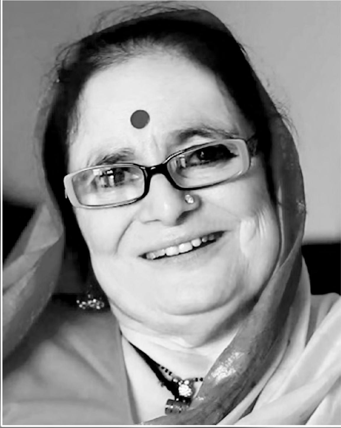
पद्मश्री पद्मा सचदेव